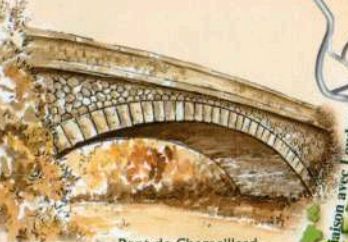
Pont de Chamallard à Berthegon

La Ligne Verte est finalement un prétexte pour découvrir un patrimoine varié autant que méconnu, dans les pays de Loudun, Lençloître et Châtellerauld.