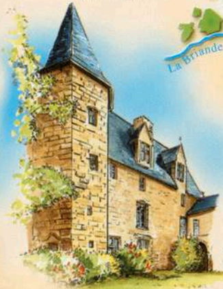
Château de Monts-sur-Guesnes