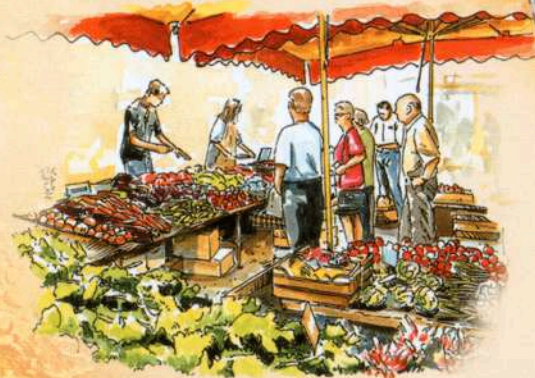
Marché de Lençloître